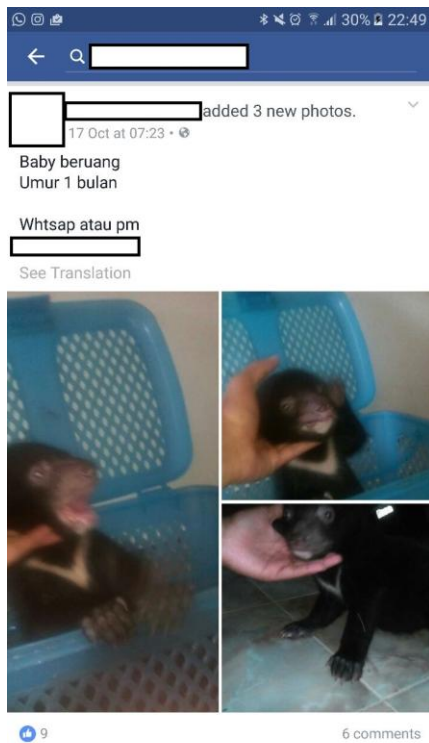
Gambar 2: Screenshot Facebook Yang Menawarkan Anak Beruang