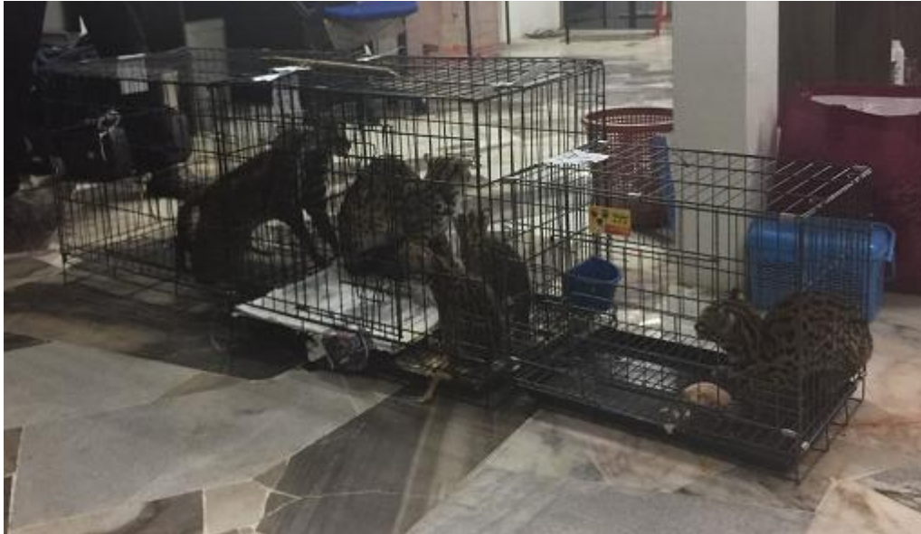
Gambar 3: Kucing Batu Yang Telah Disita Di Ampang, Selangor